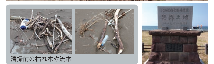
清掃前の枯れ木や流木