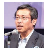
弘兼 憲史 (漫画家)

ラジオCMには音しかなく、その音の中核は言葉なので、コピーライターの責任は大きいと思います。ただし、良い言葉を連ねても、読み手が心情や感覚を掴んで読んでくれないと伝わりません。制作者はもっと「声の選択」に慎重になってほしいです。