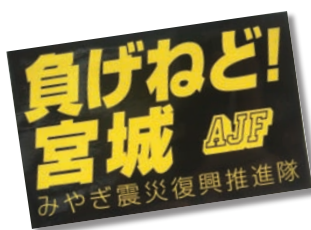
「負けねど!宮城」ステッカー